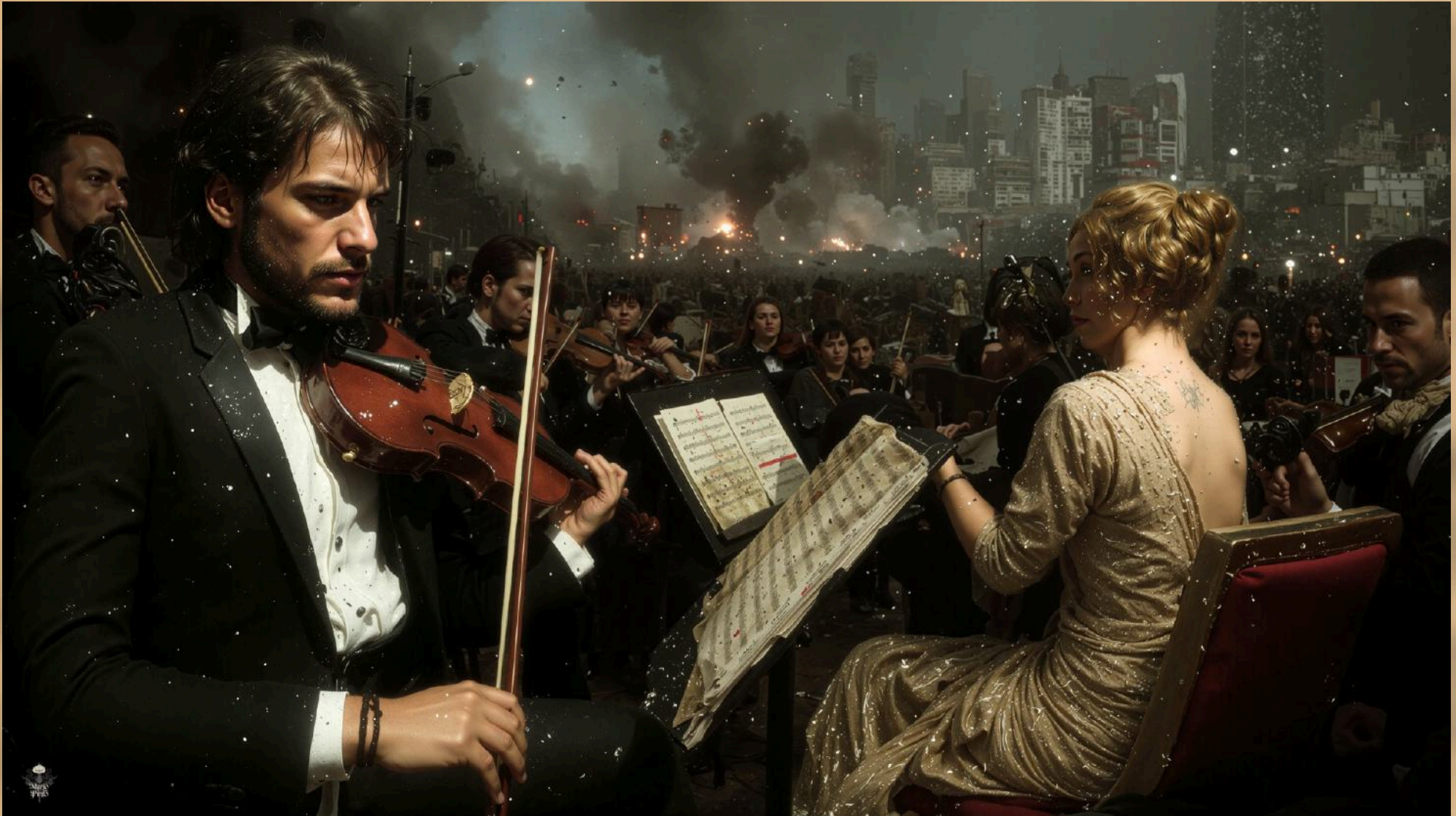
02 (2025) Técnica mixta digital. Impresión en canvas 130 cm x 89 cm