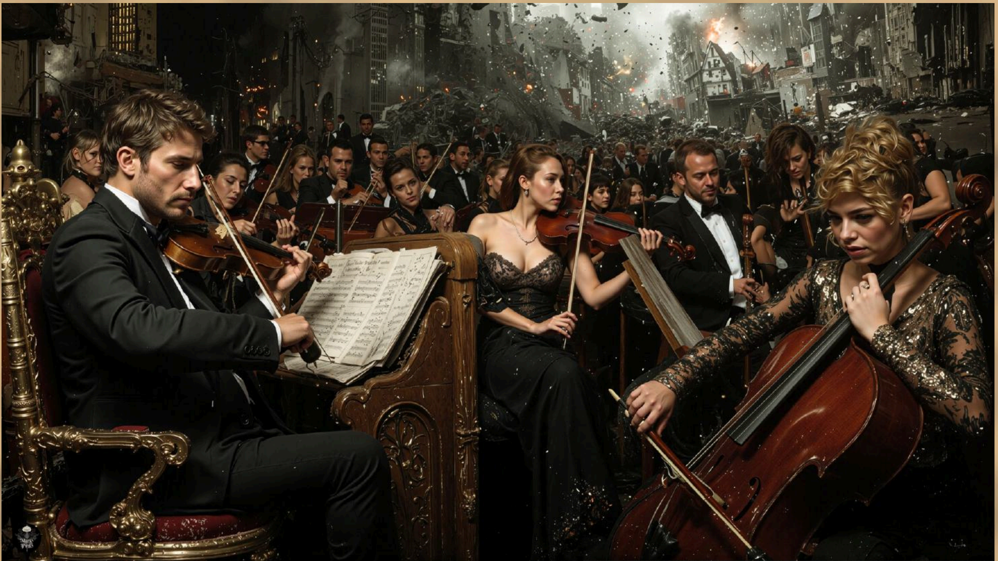
03 (2025) Técnica mixta digital. Impresión en canvas 130 cm x 89 cm