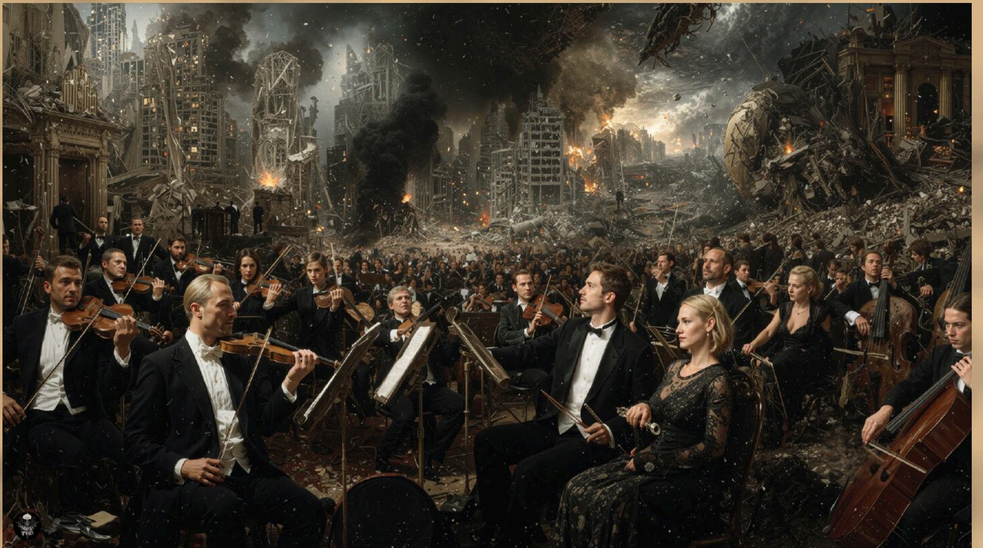
05 (2025) Técnica mixta digital. Impresión en canvas 130 cm x 89 cm