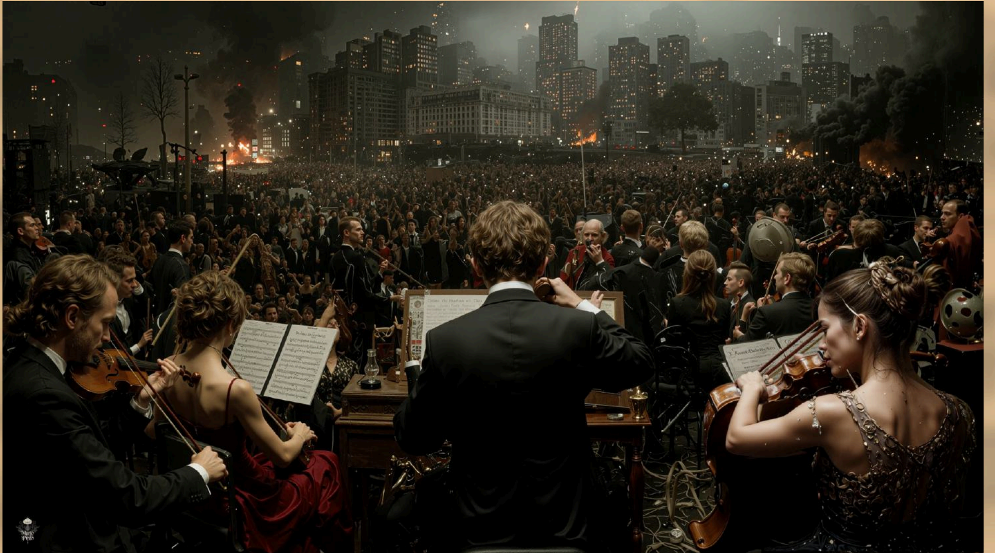
04 (2025) Técnica mixta digital. Impresión en canvas 130 cm x 89 cm