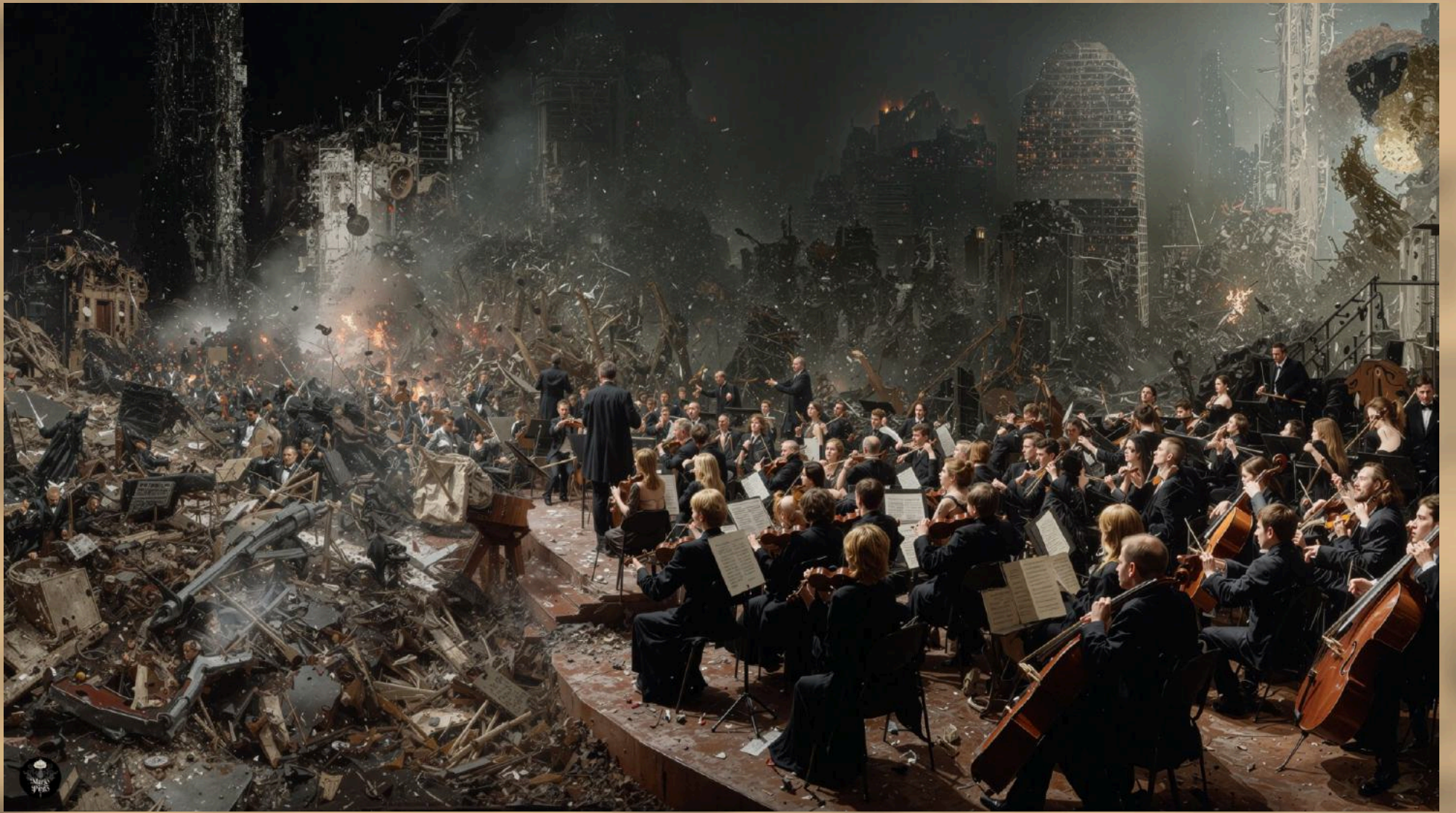
08 (2025) Técnica mixta digital. Impresión en canvas 130 cm x 89 cm