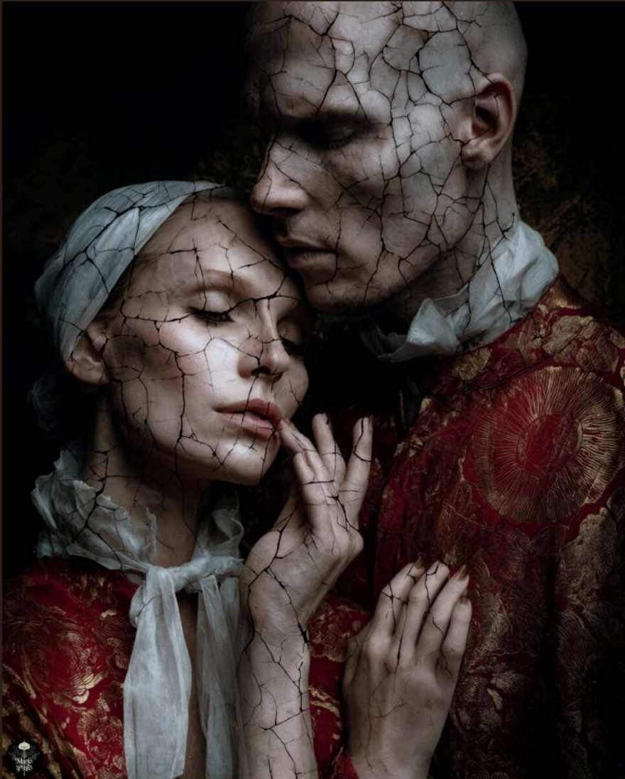
NO ERES TÚ, SOY YO (2025) Técnica mixta digital. Impresión en Canvas 40 x 50 cm