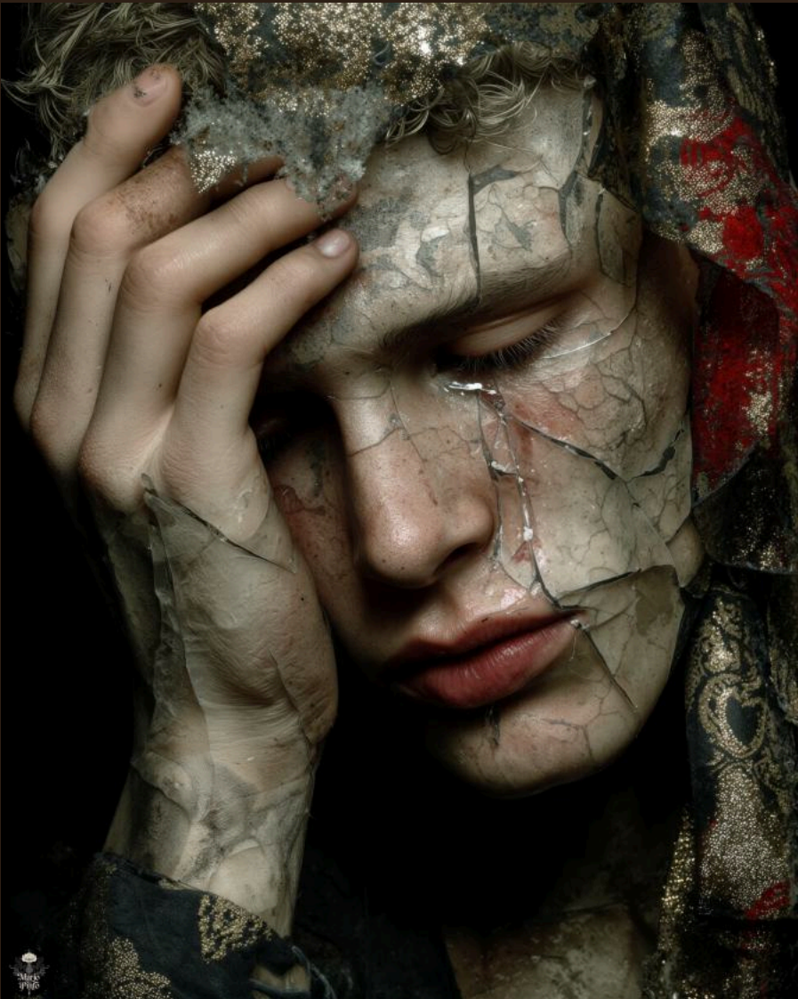
DECONSTRUCCIÓN (2025) Técnica mixta digital. Impresión en Canvas 40 x 50 cm