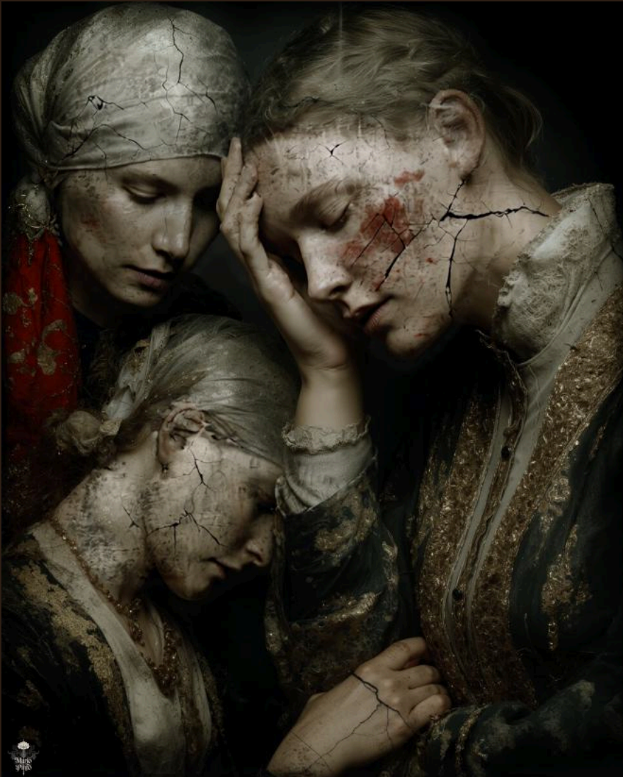
SORORITY (2025) Técnica mixta digital. Impresión en Canvas 40 x 50 cm