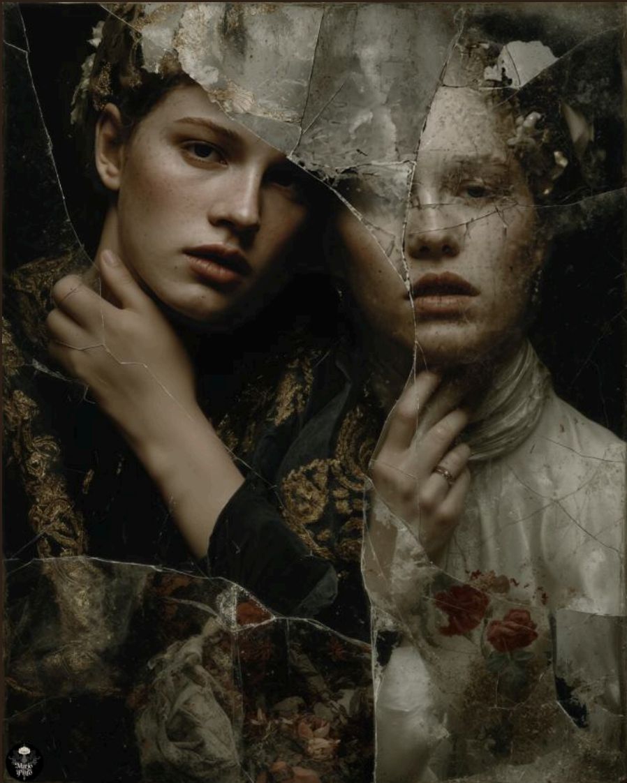
RED SOCIAL (2025) Técnica mixta digital. Impresión en Canvas 40 x 50 cm