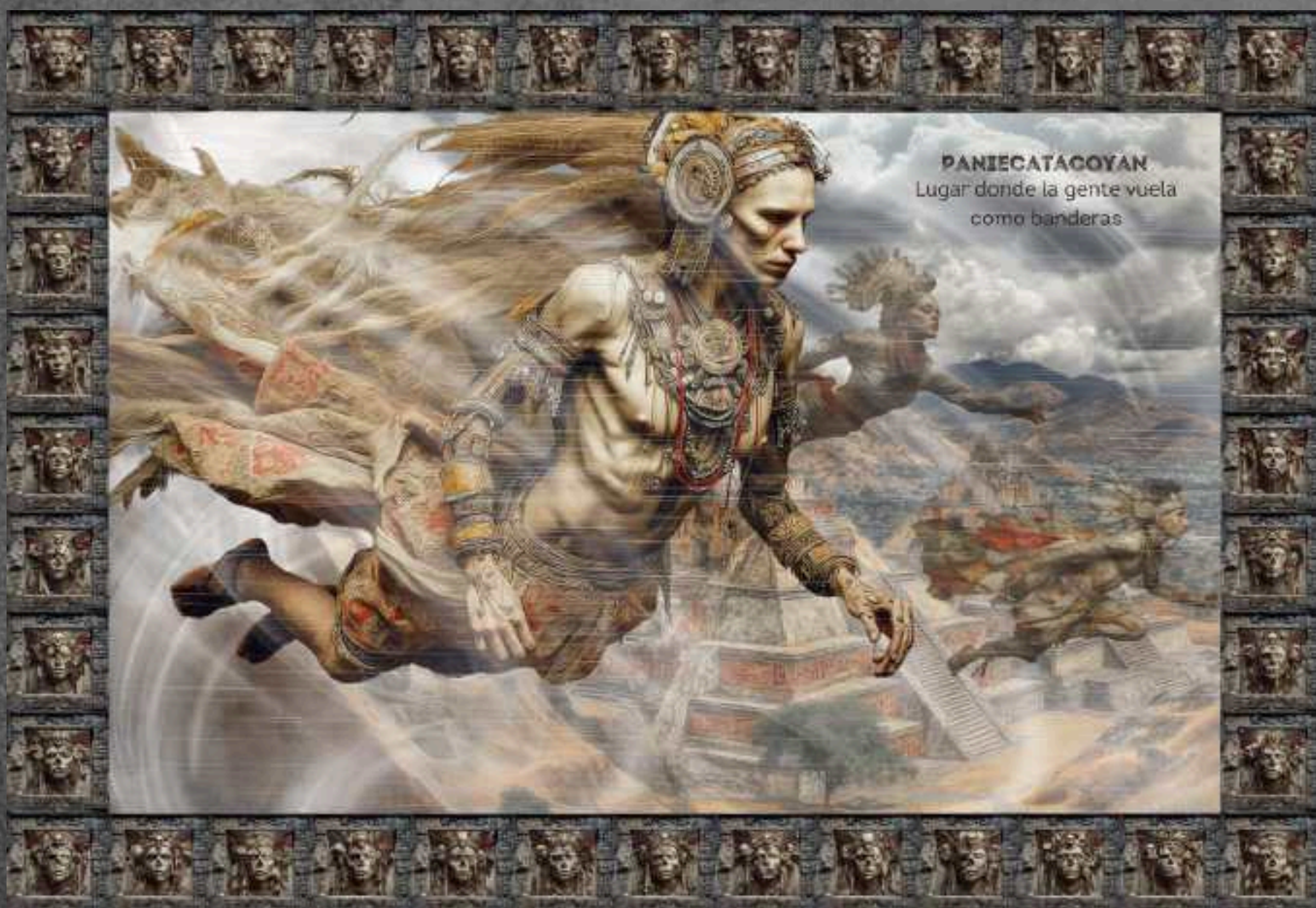
PANIECATACOYAN Lugar donde la gente vuela como banderas