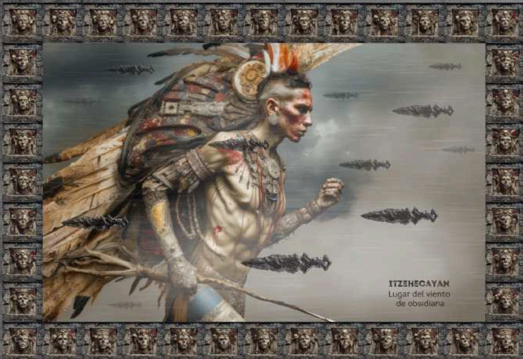
ITZEHECAYAN Lugar del viento de obsidiana